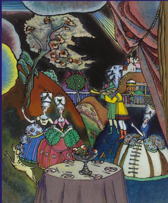
Wassily Kandinsky, Mit Früchten, 1918 Privatsammlung

Die Ausstellung ermöglicht erstmals aufgrund neuer Erkenntnisse in Maltechnik und Materialanalyse einen Blick auf, hinter und in das Hinterglasbild – und geht gemeinsam mit dem Betrachter den Rätseln der facettenreichen Technik auf die Spur.